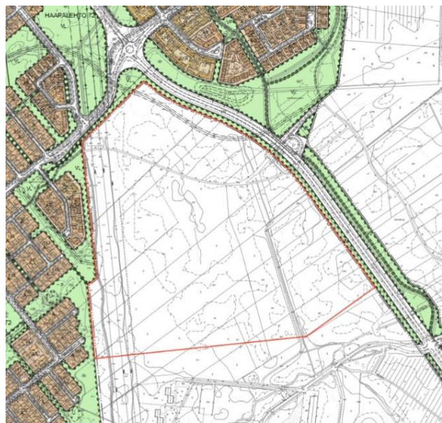
Kuvat 3 ja 4 Ote Uuden Oulun yleiskaavasta ja ote voimassa olevasta asemakaavasta