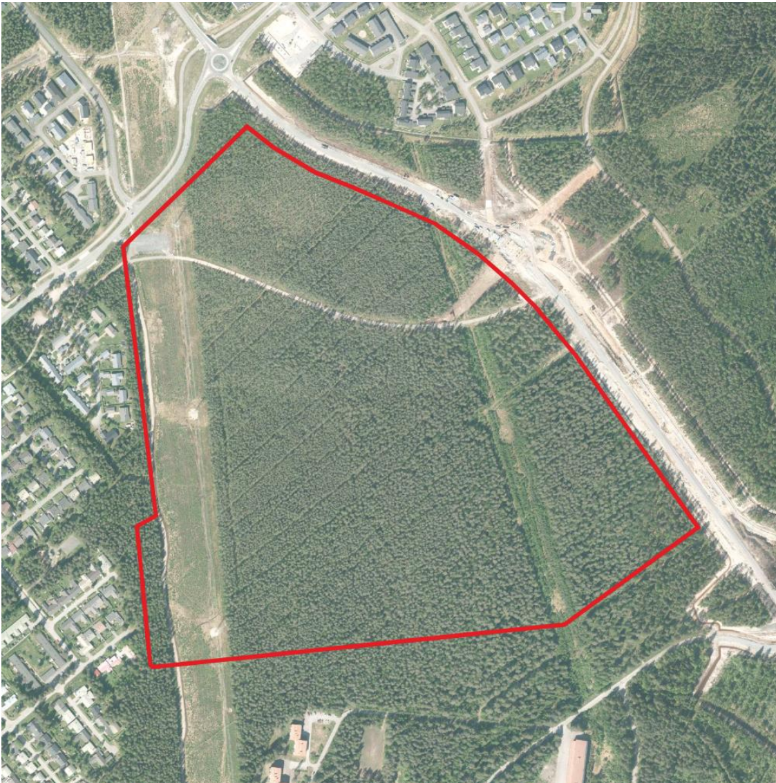
Kuva 2 Ote ilmakuvasta

Vanhan Hiukkavaaran pohjoisosa on metsäinen, asemakaavoittamaton ja rakentamaton. Alue on tärkeä viherverkostojen ja niiden yhtenäisyyden ja saavutettavuuden kannalta. Metsäisiä alueita halkovat itä-länsisuuntainen ulkoilureitti sekä pohjois-eteläsuuntaiset voimalinjat, joista toinen on jo alkanut kasvaa umpeen. Länsireunan avoin voimalinja hallitsee maisemaa ja sen yhteyteen on perustettu ulkoilureitti. Alue on ollut puolustusvoimien käytössä sekä osittain talousmetsänä ja metsä- ja suoalueet on laajalti ojitettu. Alueen pohjoisessa osassa oleva isovarpuräme ei säily alueen ympäristön rakentuessa.